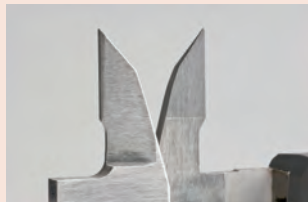
Твердосплавные губки для внешних и внутренних измерений 505-735