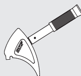
Конструкция TMFN 23-30 и TMFN 30-40