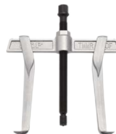
Демонтаж с захватом изнутри