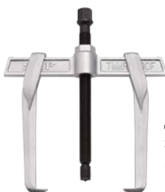
Демонтаж с захватом снаружи