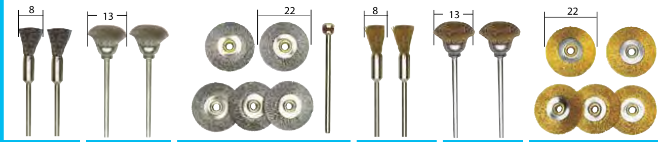
NO 28 951