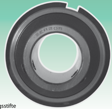
Nachsetzzeichen UNF: Zollabmessungen der Befestigungsstifte Суффикс UNF: Дюймовые размеры установочных винтов