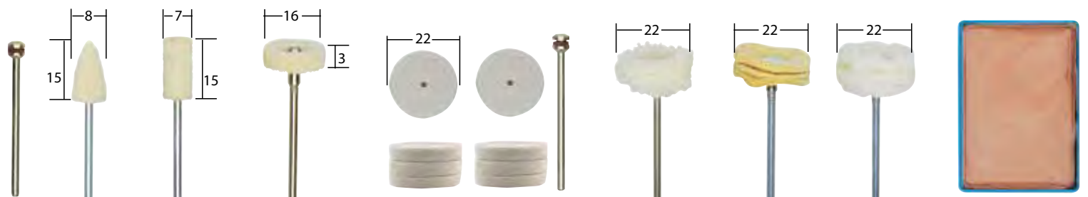
NO 28 801