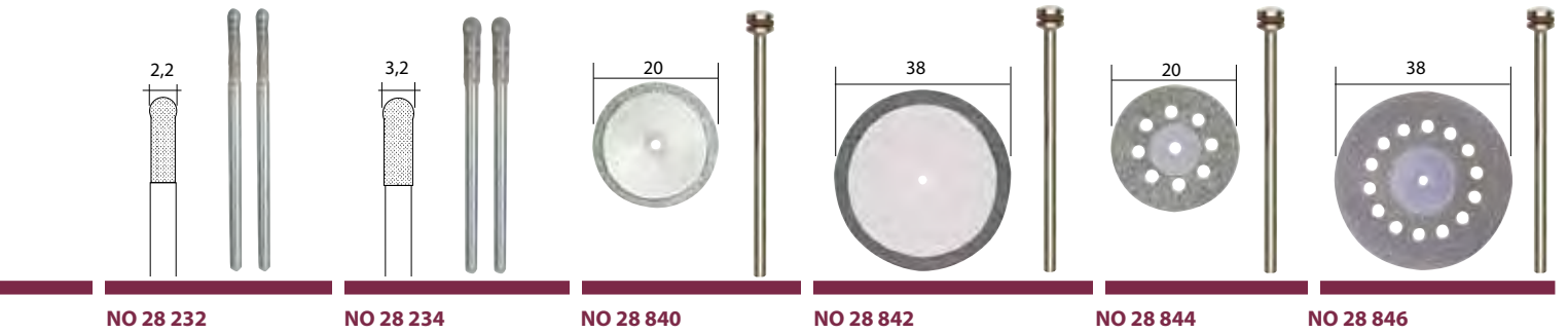
NO 28 232