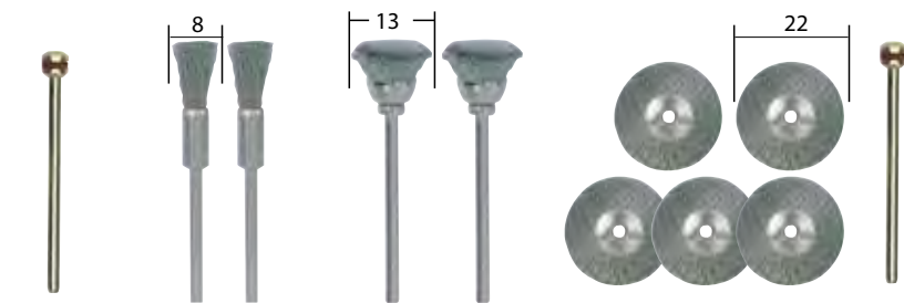
NO 28 955

Алмазный отрезной диск с вентиляционными отверстиями Для отрезания твердых и хрупких материалов. Идеален для удаления заусенцев. Вентиляционные отверстия помогают дольше работать без перегрева. Хвостовик Ø 2,35.