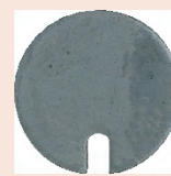
Вилочный ключ 102037