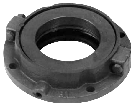
TACONITE-DECKEL КРЫШКА ИЗ ТАКОНИТА