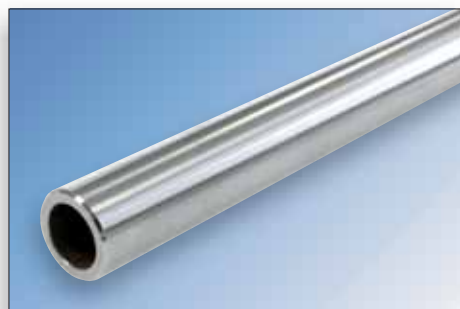
CK60 / 1.1221